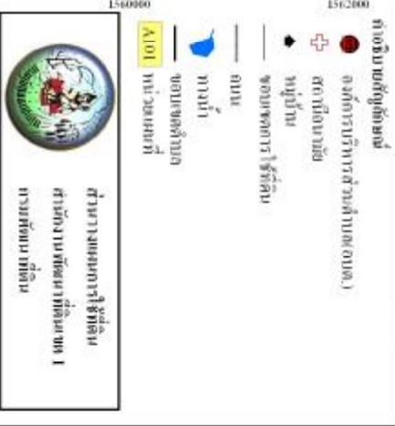
รูปที่ 3-3 แผนที่การรั้วที่ดิน ตำบลหนอง อำเภอมืองนครราชบุรี จังหวัดนครราชบุรี